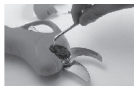
Установите фиксатор гайки

Неподвижный и подвижный ножи можно заменять по отдельности. После замены не бойтесь слишком малого раскрытия ножей. При включении, нормальный размер раскрытия восстановится автоматически.