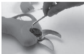
Открутите винты из фиксатора гайки ножа