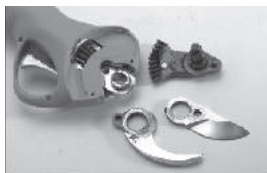
Снимите неподвижный нож