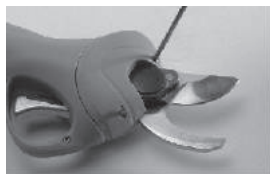
Открутите винты отверткой и откройте крышку