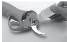
При замене ножей необходимо добавить смазочное масло между ними