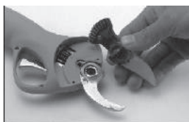
Установите ножи на место