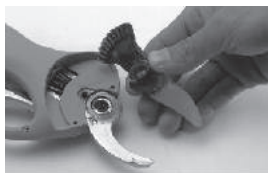
Разберите штифт и извлеките подвижный нож